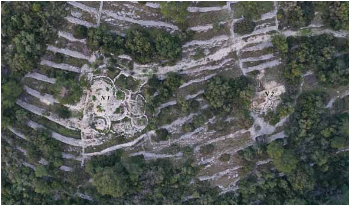
Sl. 1. Zračna snimka nekropole gradinskog naselja Kopila na otoku Korčuli (Odjel za arheologiju, Sveučilište u Zadru, snimak: L. Bogdanić) / Fig. 1. Aerial photograph of the necropolis of the hillfort settlement Kopila on the island of Korčula (Department of archaeology, University of Zadar, photo: L. Bogdanić)

ovalni oblik dimenzija 3,50 x 2,30 m s relativnom dubinom od čak 2 m. Istraživanjima je utvrđeno da je riječ o višestruko sukcesivno korištenoj grobnici, i to u razdoblju od druge polovice 4. pa sve do sredine 1. st. pr. Krista. Iako antropološka analiza još nije završena, količina ljudskih, pretežno dislociranih inhumiranih osteoloških nalaza i iznimno brojni prilozi, koje čini preko 300 keramičkih posuda, zatim velika količina nažalost loše očuvanih primjeraka željeznih kopalja i noževa, čak i na dnu položena ilirska kaciga, te stakleni, jantarni i metalni dijelovi nakita i odjeće, sugeriraju da je veliki broj odraslih pripadnika ovdašnje zajednice obaju spolova svoj životni ciklus završio upravo u ovoj grobnici. Po navedenim parametrima ona u potpunosti odgovara drugim grobnicama do sada istraženima na ovoj nekropoli. 4