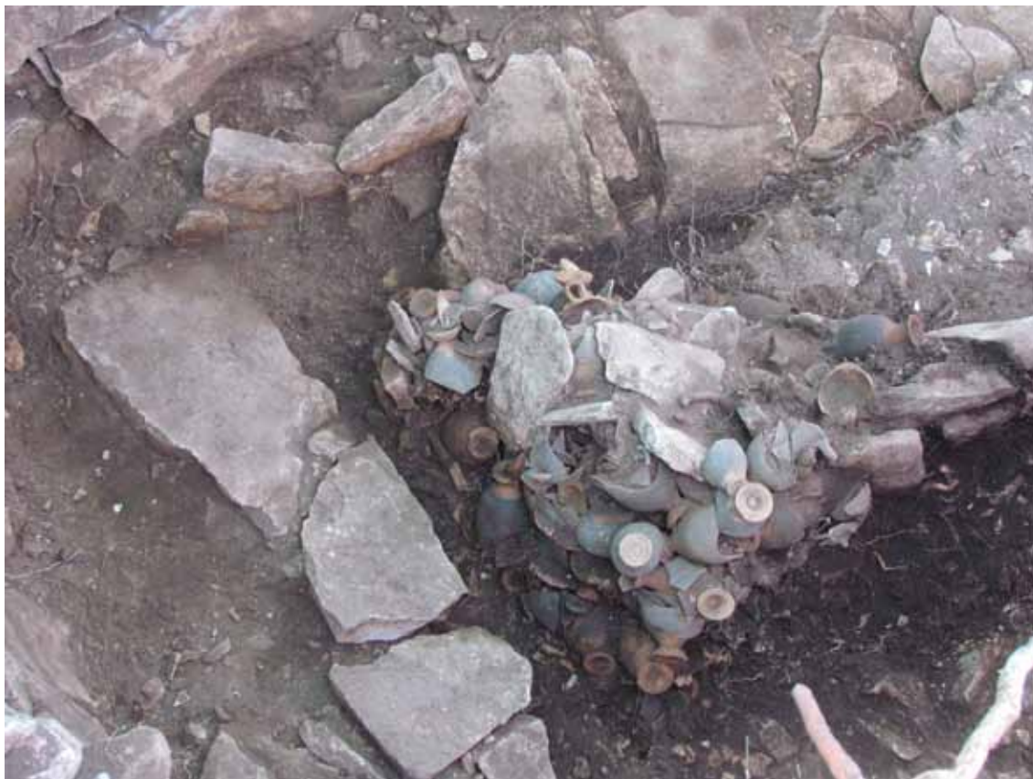
Sl. 6. Detalj s priloženim helenističkim stolnim posuđem iz Grobnice 1 Nukleusa 2 nekropole gradinskog naselja Kopila (Odjel za arheologiju, Sveučilište u Zadru) / Fig. 6. Detail with attached Hellenistic tableware from the Tomb 1 of Nucleus 2, from the necropolis of the hillfort settlement Kopila (Department of archaeology, University of Zadar)

scena lova na stećcima nema nikakve veze sa situacijom iz realnog života i da je produkt vjerovanja još pretkršćanskih vremena koje je preživjelo i antiku te putem kasnoantičkog transhumantnog stanovništva na Balkanu, Vlaha, doseglo i kasni srednji vijek. 50