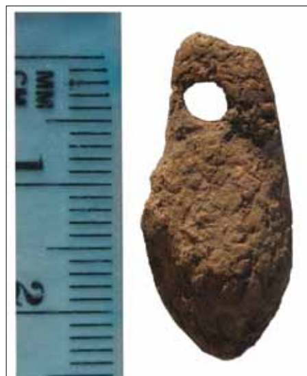
Sl. 5. Privjesak od jelenjeg zuba iz Grobnice 7 Nukleusa 1 nekropole gradinskog naselja Kopila (Centar za kulturu, Vela Luka, snimak: D. Radić) / Fig. 5. Deer tooth pendant from the Tomb 7 of Nucleus 1, from the necropolis of the hillfort settlement Kopila (Culture center, Vela Luka, photo: D. Radić)

I upravo u posljednje rečenom leži temelj glavne dvojbe na koji način tumačiti ovaj prikaz – treba li ga idejno maksimalno pojednostavniti i poistovjetiti sa životnim afinitetima i uspjesima pokojnika uz kojeg je priložena ovako oplemenjena posuda ili ga pak uzdići u izraženija i dublja simbolička značenja. Željeznodobna kopilijanska zajednica je sasvim sigurno dio svojih prehrambenih potreba zadovoljavala lovom. 10 Dosadašnja fokusiranost na istraživanje nekropole naselja nije rezultirala osteološkim materijalom životinjskog podrijetla koji bi pružio uvid u njegovu strukturu i time napravio distinkciju između zastupljenosti domaćih uzgojnih i divljih lovnih životinja. No, da su se među onim potonjim znale naći i životinje iz porodice jelena svjedoči jedan perforirani očnjak (tzv. grandle ), najvjerojatnije nošen kao dio ogrlice priložene u sklopu dječje Grobnice 7 Nukleusa 1 (sl. 5). 11