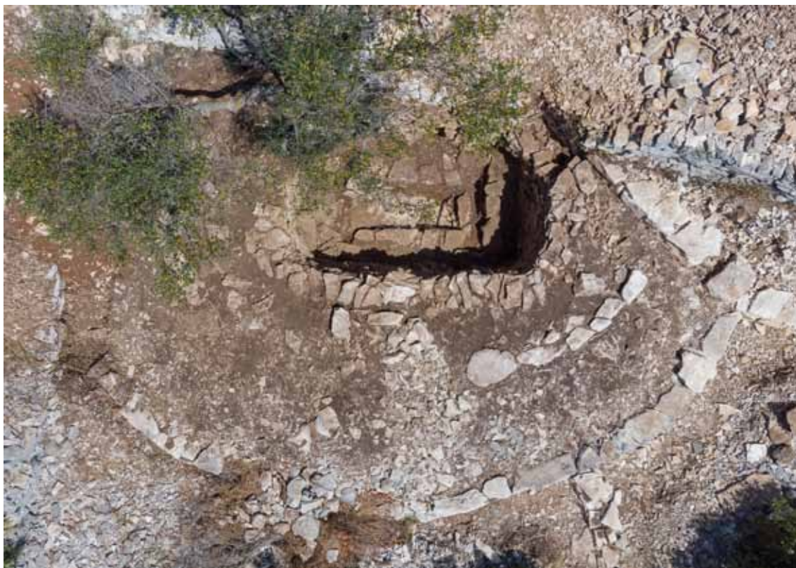
Sl. 2. Grobnica 1 Nukleusa 2 nekropole gradinskog naselja Kopila (Odjel za arheologiju, Sveučilište u Zadru, snimak: L. Frlan) / Fig. 2. Tomb 1 of Nucleus 2 of the hillfort settlement Kopila (Department of archaeology, University of Zadar, photo: L. Frlan)

Naravno, puko tipološko, kronološko i provenijencijsko određenje posude nije razlog njezina izdvajanja iz mase sličnih i identičnih keramičkih priloga iz ove i ostalih kopilijanskih grobnica, a koju uzgred rečeno za sada čine kasnokanoški i isejski primjerci keramike tipa Gnathia, te različiti oblici crno, sivo i smeđe premazane helenističke, pretežito stolne keramike. 8 Ono pak leži u činjenici što je na njezinom trbuhu urezivanjem, dosta jednostavno, ali realistično prikazana scena lova (sl. 3; sl. 4). Na lijevom dijelu scene je dijelom oštećen siluetni prikaz figure lovca, s anatomski jasno izraženom glavom, uzdignutom desnom rukom, koničnim trupom i nogama raširenih stopala. Određenje ove figure kao lovca argumentira u desnoj ruci držeće koplje s vrlo realistično prikazanim listolikim vrškom. Koplje, očito prikazano u trenutku bacanja, usmjereno je prema životinji u trčućem bijegu. Njezino izduženo tijelo s kratkim repom te dugim vratom i oštrom njuškom na uskoj glavi s jasno istaknutim izdancima (visoke uši ili kratki rogovi?) neodoljivo podsjećaju na košutu ili mladog jelena. Između dva krajnja lika, dakle lovca i lovine, jasno se vidi prema lovini usmjeren prikaz manje trčće životinje s dugim repom, izduženom njuškom i kratkim ušima, koja se po svemu sudeći mora poistovjetiti s psom. Njegovo pozicioniranje daje izvjesnu simetričnost čitavoj kompoziciji, koja je uz to i nadsvođena ravnom, lagano prema gore zakošenom crtom urezanom odmah podno vrata posude.