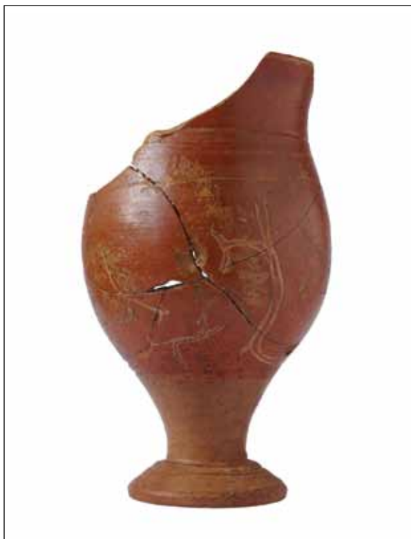
Sl. 3. Skif s motivom lova iz Grobnice 1 Nukleusa 2 (Centar za kulturu Vela Luka, snimak: I. Kolovrat) / Fig. 3. Skyphos with a hunting scene from the Tomb 1 of Nucleus 2 (Culture center, Vela Luka, photo: I. Kolovrat)